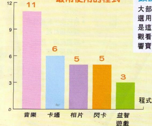
人數(個) 最常使用的程式

大部份媽媽都沒有特別設定一個使用智能產品的時間，她們大多會在空閒時才讓寶寶使用，有時則會在寶寶主動要求下才讓他們玩。