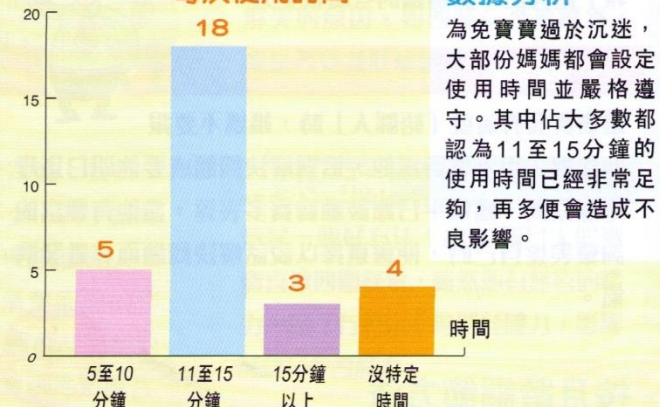
人數(個) 每次使用時間

大部份媽媽都為寶寶選用音樂程式，原因是這類型的程式毋須觀看熒幕，可避免影響寶寶的眼睛。