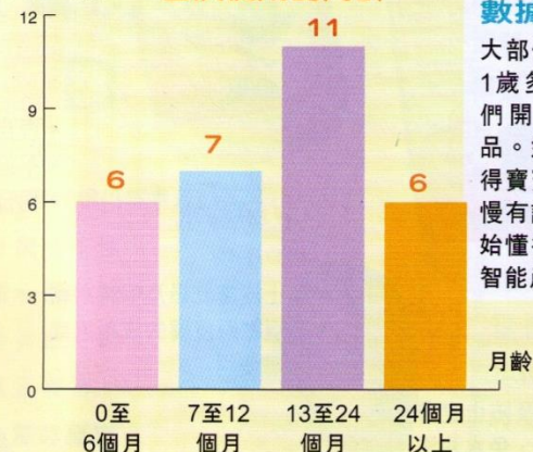
人數(個) 首次使用的月齡